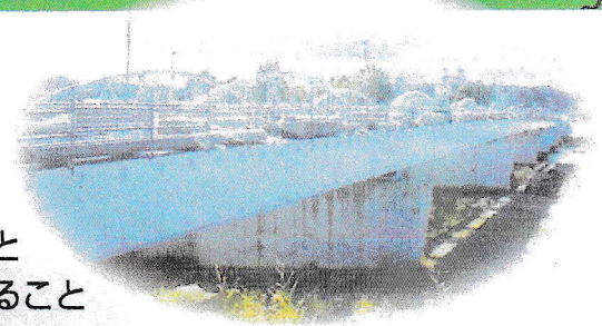
工事中の(仮称)新乙津橋(鶴崎側より)